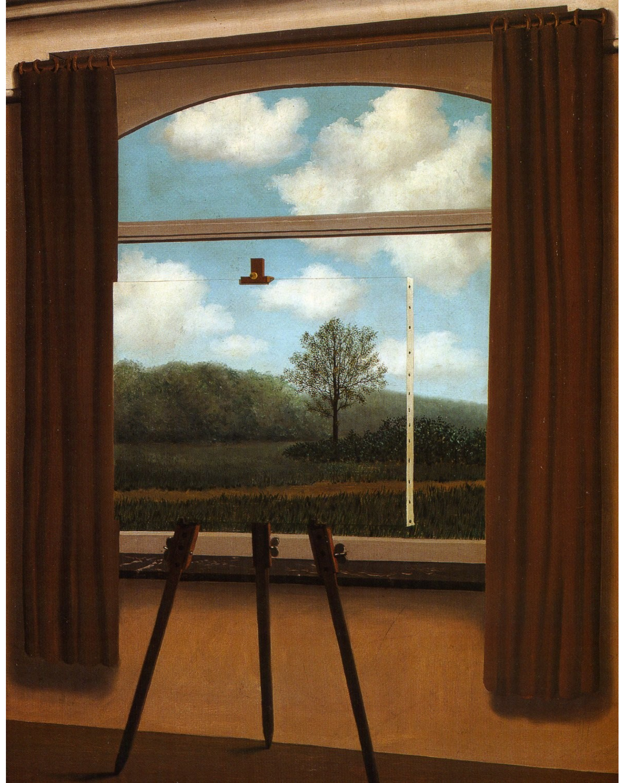
René Magritte: La Condition Humaine